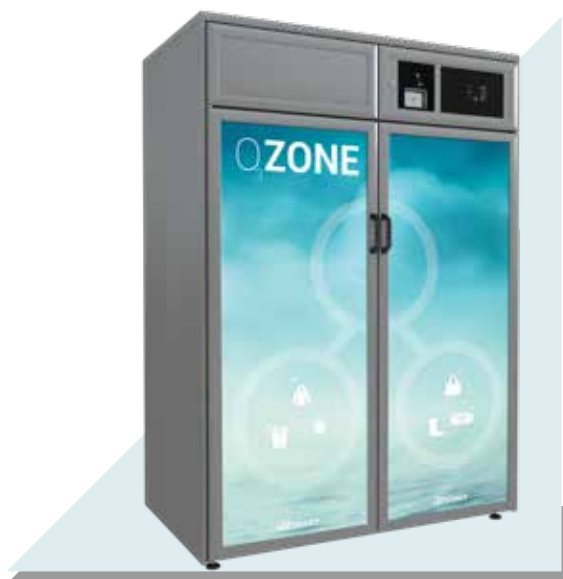
O-CAB 1250 1252 LITROS