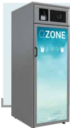
O-CAB 600 626 LITROS