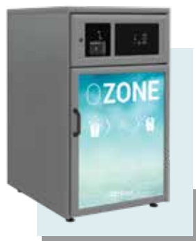
O-CAB 300 313 LITROS