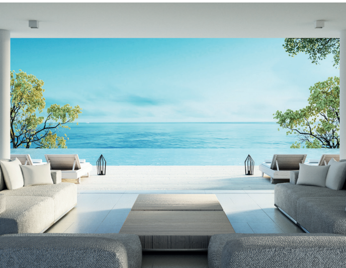
Hoteles y hostales Hotels and hostels