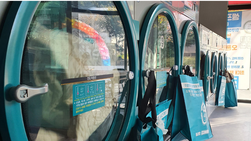
Autoservicio Coin Laundries