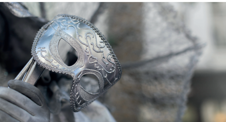
Ropa de teatro Theater clothing