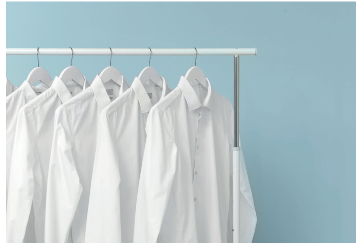
Tintorerías Dry cleaner's