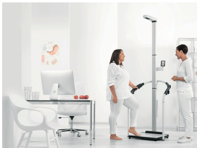
Sector sanitario Healthcare sector