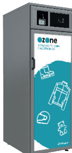
O-CAB 600 626 LITROS