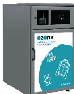
O-CAB 300 313 LITROS