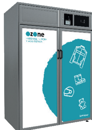
O-CAB 1250 1252 LITROS